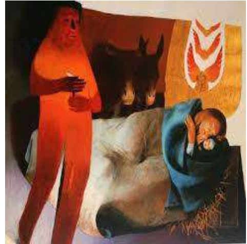
Arcabas, la naissance à Bethléem